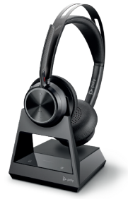
VOYAGER FOCUS 2 OFFICE