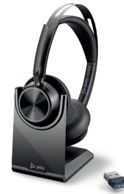
VOYAGER FOCUS 2 UC COM BASE DE CARREGAMENTO