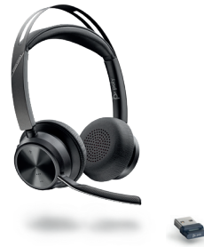
VOYAGER FOCUS 2 UC